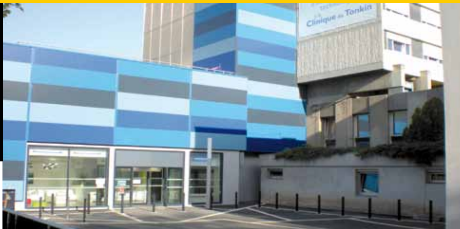
Clinique du Tonkin, Villeurbanne, pionnière dans l'accueil des internes depuis 1974.